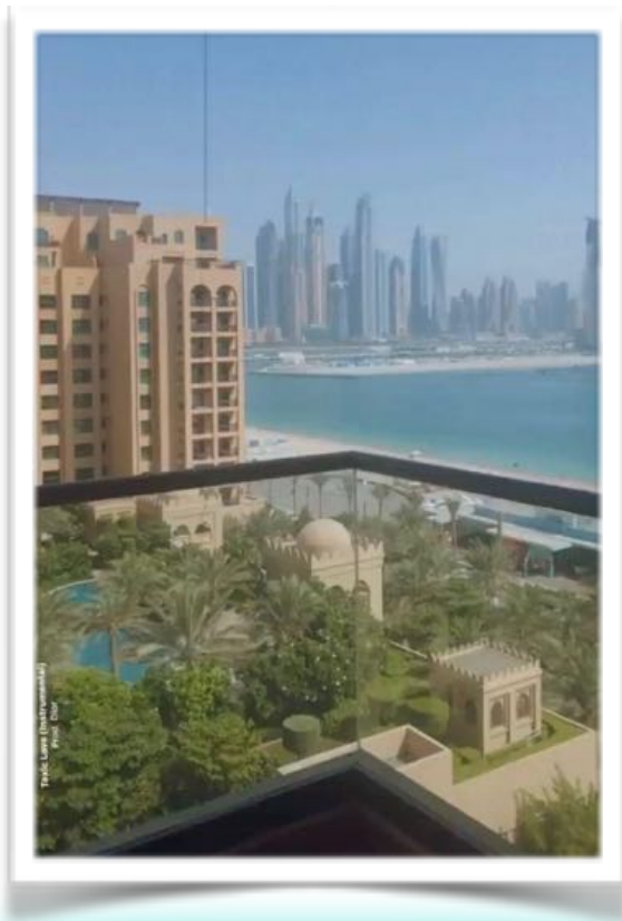
Postcard from Dubai ❤️

Der Wunsch meiner Mutter war es schon immer, einmal nach Dubai zu fliegen. Also entschied sich mein Vater Tickets zu buchen. Wir erzählten das mit voller Freude meiner Mutter und sie freute sich sehr. Und am 8. Juli 2021 ging es los.